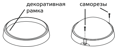
Рис. 1. Установка светильника